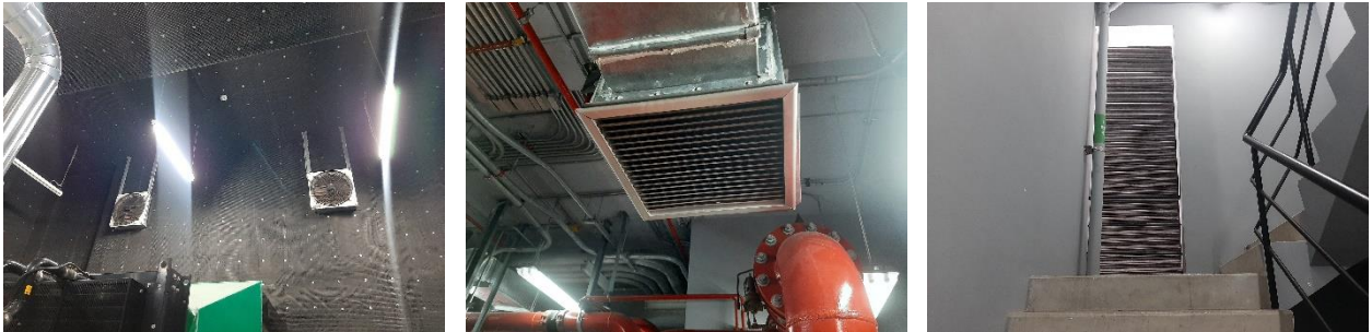
ภาพที่ 1.3-1 การระบายอากาศในพื้นที่โครงการ

ปัจจุบันโครงการมีการระบายอากาศในพื้นที่โครงการ 2 วิธี ได้แก่ การระบายอากาศโดยวิธีธรรมชาติ โดยจัดให้มีช่องเปิดสู่ภายนอกอาคารได้ เช่น ประตู หน้าต่างหรือบานเกล็ด และการระบายอากาศโดยวิธีกล โดยโครงการจะติดตั้งพัดลมระบายอากาศในพื้นที่ใช้สอยต่างๆ เพื่อให้อากาศมีการหมุนเวียนมากขึ้น โดยรายละเอียดระบบระบายอากาศและปรับอากาศของโครงการส่วนใหญ่สอดคล้องกับรายละเอียดในรายงานการประเมินผลกระทบสิ่งแวดล้อม (ภาพที่ 1.3-1)